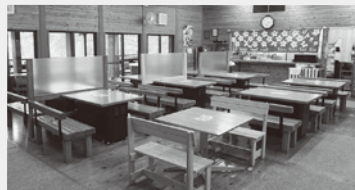
▲お食事は広々としたテーブル席で!

雪そり遊びを満喫したらお腹は空くもの…。 レストランげんき亭で、温かな美味しいお食事をどうぞ。