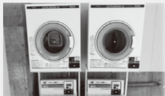
▲濡れてしまった服も乾かせます!